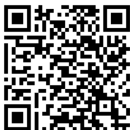
月額会員登録用 QR コード